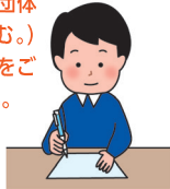
代表者がお手続き